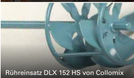
Rühreinsatz DLX 152 HS von Collomix