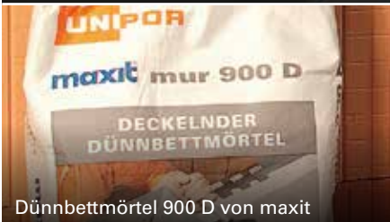
Dünnbettmörtel 900 D von maxit