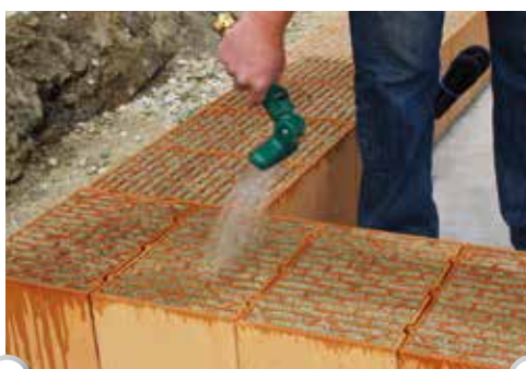
1 Ziegelreihe befeuchten