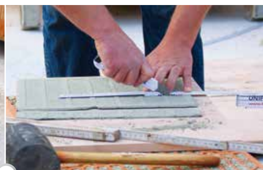
3 Bei Bedarf zuschneiden