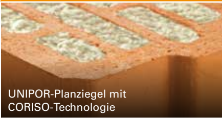
UNIPOR-Planziegel mit CORISO-Technologie