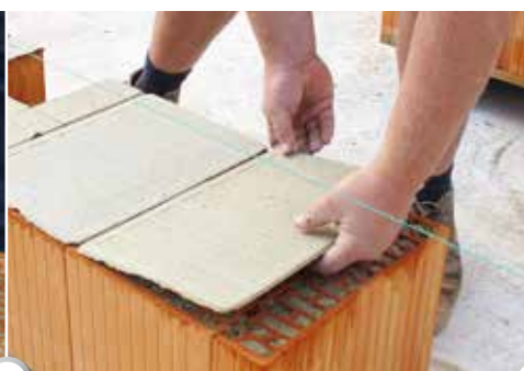
2 Mörtelpads auflegen